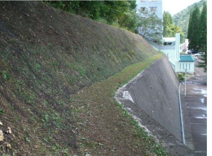
落石防止ネット施工後①