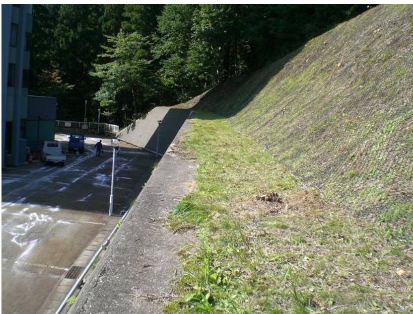
落石防止ネット施工後②